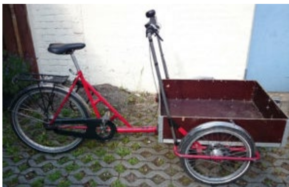
Lastenrad ASTA TU Braunschweig