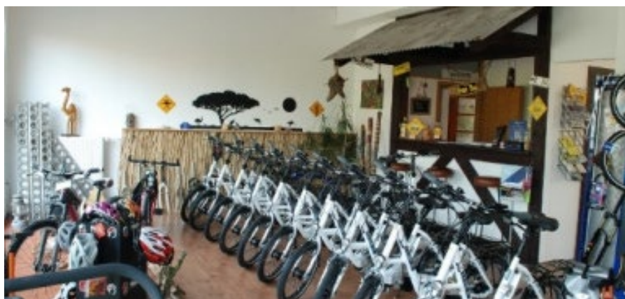
E-Bike-Station Bike and Barbecue Hornburg